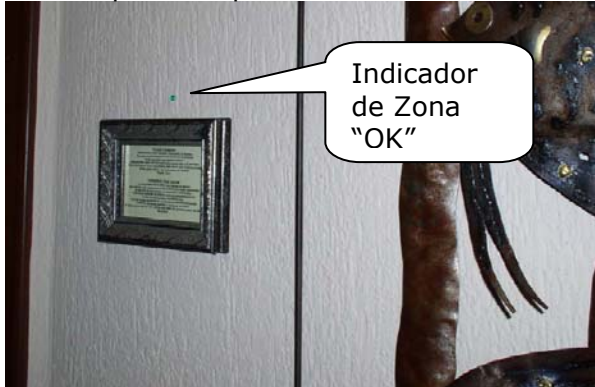
Instalación en pared cerca de termostato

ACC+ esta disponible de dos maneras: completamente instalado o como parte de un equipo que usted instala. Varios resorts grandes han sido equipados con ACC+ así que muchas veces , una instalación rápida y eficiente esta disponible si lo solicita. Juegos genéricos con únicamente partes tambien estan diponibles para estos mismos resorts.