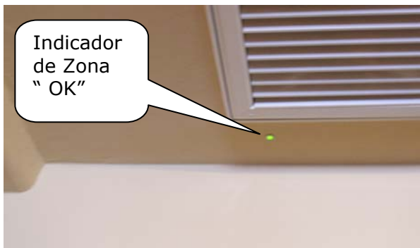
Instalación de techo cerca del retorno de aire.